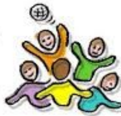
S P E L