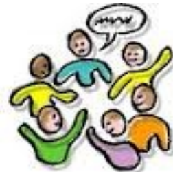
G E S P R E K