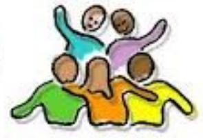
V I E R I N G