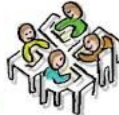
W E R K